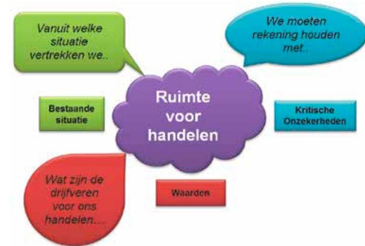
Figuur: structuur scenario's

Toekomstige ontwikkelingen zijn nog nauwelijks goed te duiden met concepten die worden gevormd door de samenstelling van dichotomieën (hoog-laag, groot-klein). Verschillende wetenschappers hebben in hun werk aangetoond dat we in een tijdperk leven waarin tal van ontwikkelingen tegelijkertijd plaatsvinden en elkaar niet uitsluiten of elkaar vaak juist nodig hebben (o.a. Beck en Giddens). In denkexercities rondom de kritische onzekerheden (luchtvaart, klimaatverandering en verhouding overheid en samenleving) zijn we een aantal van deze tegengestelde ontwikkelingen tegengekomen.